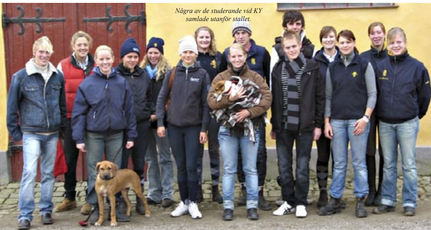
Några av de studerande vid KY samlade utanför stallet.